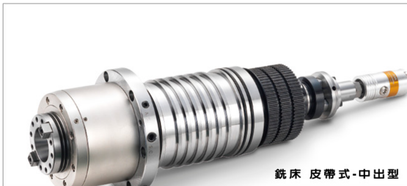
銑床 皮帶式-中外型